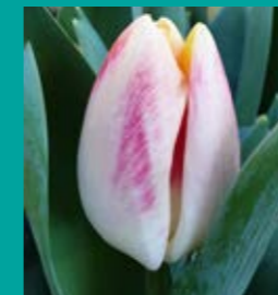
CULTIVAR: Buckingham INZENDER: COMBITULP

Sacre Coeur is een prachtige rode tulp uit de stal van Bola Veredeling. Het is een kruising tussen Ile de France en Double Price. De tulp is breed inzetbaar, want hij is van vroegtijdig tot laat te broeien, zowel op water als op potgrond. Het is een snelle cultivar die zeer gelijkmatig opkomt. In de teelt geeft Sacre Coeur genoeg leverbare bollen en genoeg plantgoed. De bollen zitten goed in de huid. Kortom, een aanwinst voor het bollenvak.