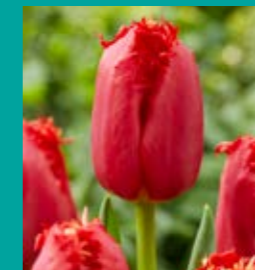
CULTIVAR: Red Hot Chili Pepper INZENDER: VERTUCCO

Buckingham komt uit de stal van Combitulp en is een kruising tussen Zorro en Dynasty. Het gaat om een zeer zware geelrode tulp die uitstekend geschikt is voor broei op water. Dit leidt tot een minimaal gewicht van 40 gram. Het blad is donker groen en de bloem valt mooi tussen het blad. De bollen groeien heel goed met slechts een enkel geval van zuur. Daarmee is de tulp een aanwinst voor zowel de kweker als de broeier.