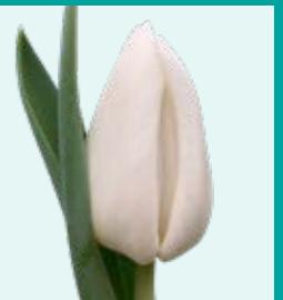
CULTIVAR: White River INZENDER: BORST BLOEMBOLLEN

Firefly® is een nieuwe, veelbelovende gele broeitulp uit de kraam van Remarkable Tulips. De cultivar is in te halen vanaf 20 december en heeft ongeveer 22 kasdagen nodig. Uit de testen komt een gemiddeld vaasleven van acht dagen naar voren. In de teelt zit Firefly® in het vroege/midden segment. De tulp is licht gevoelig voor TBV en is goed te selecteren op het blad.